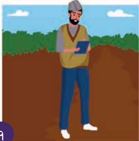
१ मल बारे जानकारी रेकर्ड गर्नुहोस्

मलको रेकर्ड राख्नु ताजा बालीकोको सुरक्षाका लागि महत्त्वपूर्ण छ र कुनै सम्भावित दूषित प्रभाव पत्ता लगाउन मद्दत गर्छ। राम्रो रेकर्ड राख्नु: