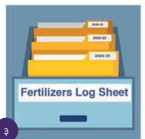
३ रेकर्ड कम्तीमा २ वर्ष सम्म सुरक्षित राख्नुहोस्