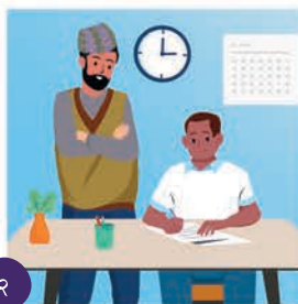
२ फार्म व्यवस्थापकले रेकर्ड प्रमाणीकरण गर्नुहोस्